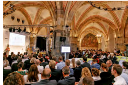
AC 2 Prämierungsfeier im vollbesetzten Krönungssaal

Alexander Willkomm AIXITEM GmbH, Eschweiler