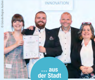
... aus der Stadt Aachen