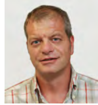
Alexander Kalawrytinou PALLAS Oberflächentechnik GmbH & Co. KG