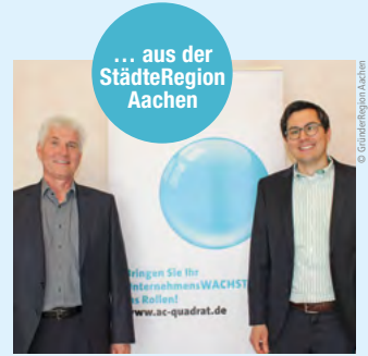
... aus der StädteRegion Aachen