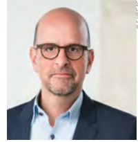
Bernhard Kugel S-UBG Aktiengesellschaft Unter- nehmensbeteiligungsgesellschaft für die Regionen Aachen, Krefeld und Mönchengladbach