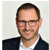
Christoph Werner ID Ingenieure und Dienst- leistungen Gesellschaft mit beschränkter Haftung