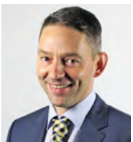
Thomas Roth Gözl GmbH