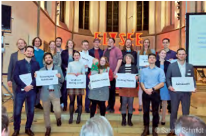
AC 2 -Zwischenprämierung 2020